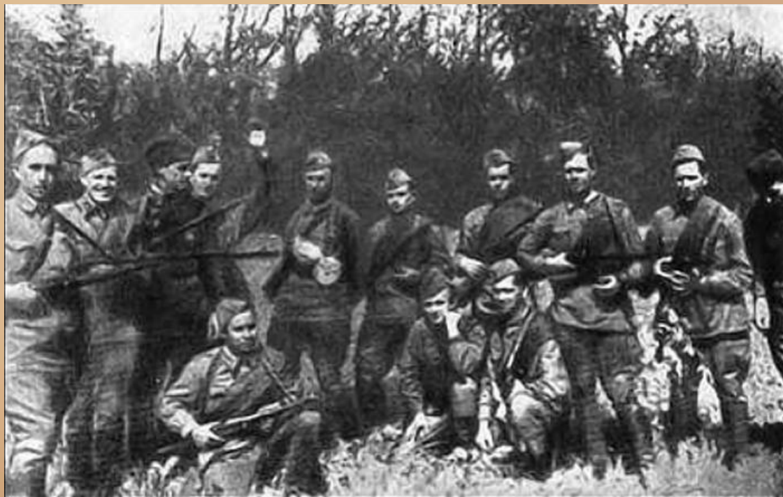
Партизанский отряд «Победители»