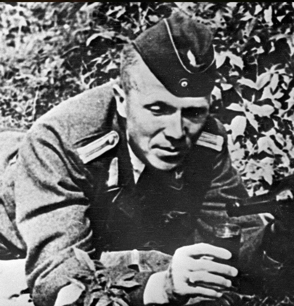
Николай Иванович Кузнецов.