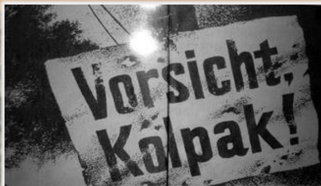
Надпись на немецком языке «Осторожно, Ковпак!»