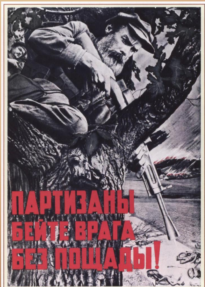
Корецкий В., Гицевич В. «Партизаны, бейте врага без пощады!». 1941