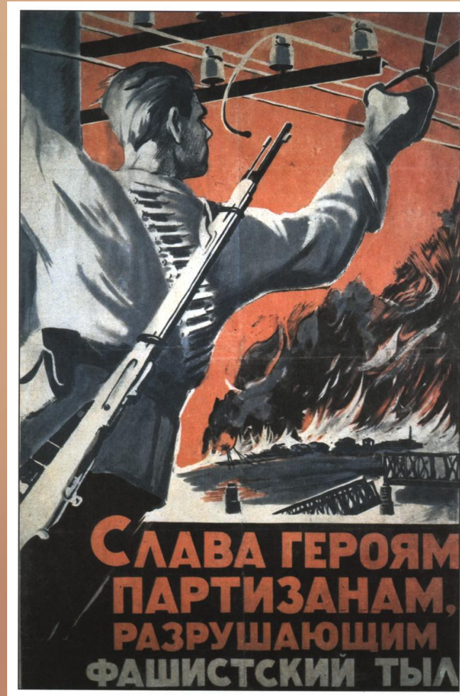
Горелый П. Слава героям партизанам, разрушающим фашистский тыл! 1941